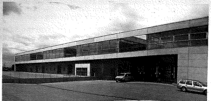
Juli 2006: Der Neubau des Pharmagroßhändlers Fiebig geht zielstrebig in die Vollendung